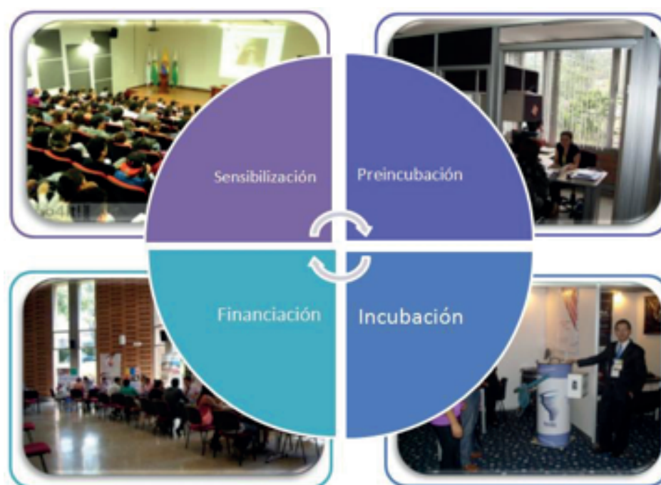
Figura 2. Unidad de Emprendimiento y Desarrollo empresarial, Universidad de Medellín.