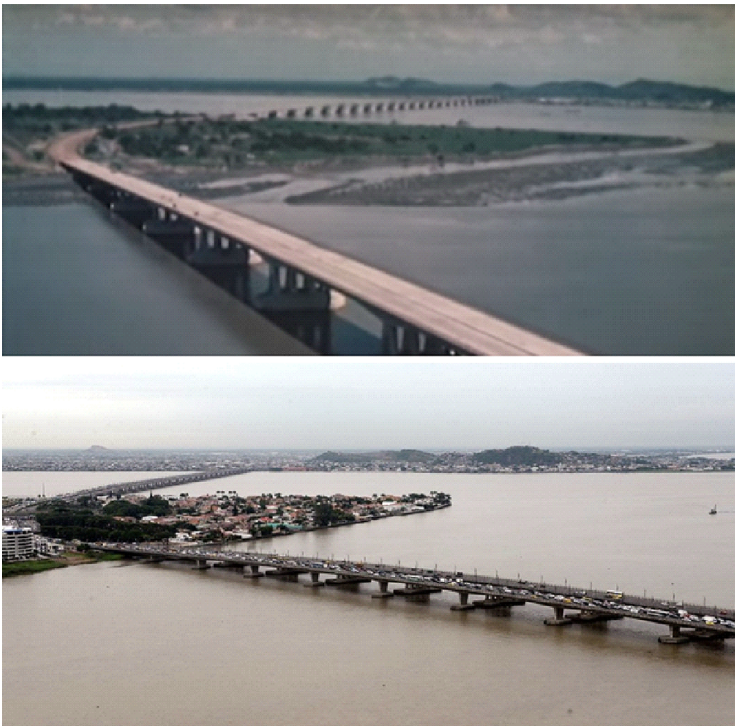
Figura 2. Fotografía del puente de la Unidad Nacional construido para unir Guayaquil, el sector la Puntilla-Samborondón y Durán, antes de la urbanización de la ciudadela residencial la Puntilla

comprar esas tierras de las anteriores haciendas a los militares que gobernaban en la dictadura del presidente Guillermo Rodríguez Lara (1972-1976); sin embargo, la élite guayaquileña —terratenientes— habló con el régimen militar, y esta propuesta no prosperó. Por el contrario, en 1995 había arrancado el proyecto más exclusivo de las élites guayaquileñas: la urbanización residencial sobre la isla Mocolí, ubicada entre la vía Samborondón y Durán, sobre el río Babahoyo, en el kilómetro 6 de la vía a Samborondón. Estas tierras cosechaban arrozales, con 306 hectáreas adquiridas para construir este complejo residencial que está formado por cinco urbanizaciones: la Ensenada (Punta Mocolí-LFC), Arrecife, Mocolí Golf Club, Mónaco y Dubái.