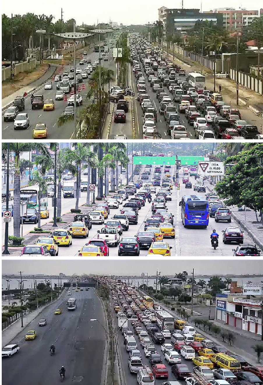
Figura 4. De arriba abajo: congestión vehicular sobre la vía a Samborondón en la parroquia urbana satélite la Puntilla; congestión vehicular sobre la avenida Menéndez Gilbert en Guayaquil; congestión vehicular en Durán sobre el tramo del puente de la Unidad Nacional que conecta Durán-la Puntilla-Guayaquil